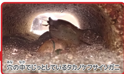
穴の中でじっとしているタカノケフサインガニ

フサインガニは、干潟では潮だまりの中の岩やネットの下、巻き貝の貝がらの中などに隠れています。水槽のタカノケフサインガニをよく思い出しながら、干潟でカニが隠れていそうな場所を探してみましょう。