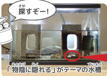
「物陰に隠れる」がテーマの水槽

狭いすき間で「かくれんぼ」 2階の観察コーナーでは、三番瀬で見られる生きものたちを水槽で飼育し紹介しています。はじめに、「物陰に隠れる」がテーマの水槽を見てみましょう。この水槽には「タカノケフサインガニ」がくらしています。どこにいるのでしょうか。水槽の中には穴の開いたブロックがふたつ。穴をのぞいてみると……いました。からだを縮めてじっとしています。四角く平べったいからだが特徴のタカノケ