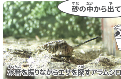
水管を振りながらエサを探すアラムシロ

三番瀬干潟では、潮だまりの中で水管を大きく振りながら歩くアラムシロを見つけることができます。砂の上で動いている巻き貝がないかよく観察してみましょう。見つからない時は砂を少しだけ掘ってみると出てくることがあります。干潟でエサを食べているアラムシロを見られたらラッキーですね。