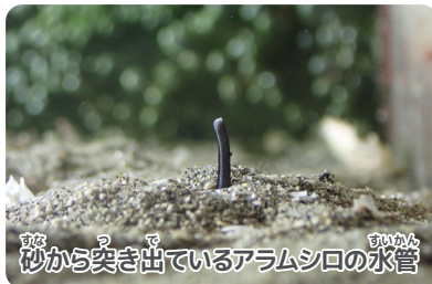
砂から突き出ているアラムシロの水管

この部分で水の中のおいを感じることができます。水槽にエサを入れると、水管が動いて砂の中からアラムシロたちが出てきました。アラムシロは肉食で、弱っていたり死んだ生きもののお肉が好きです。